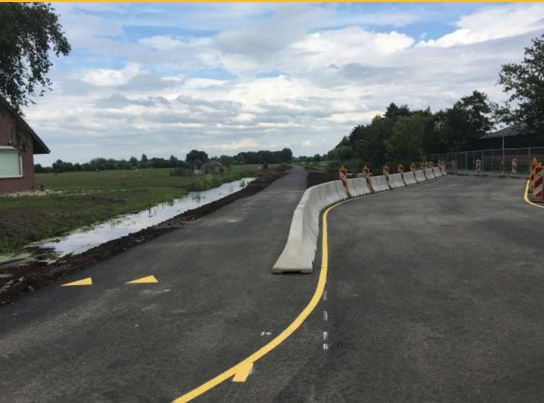
Afbeelding 3 - Het eindresultaat.