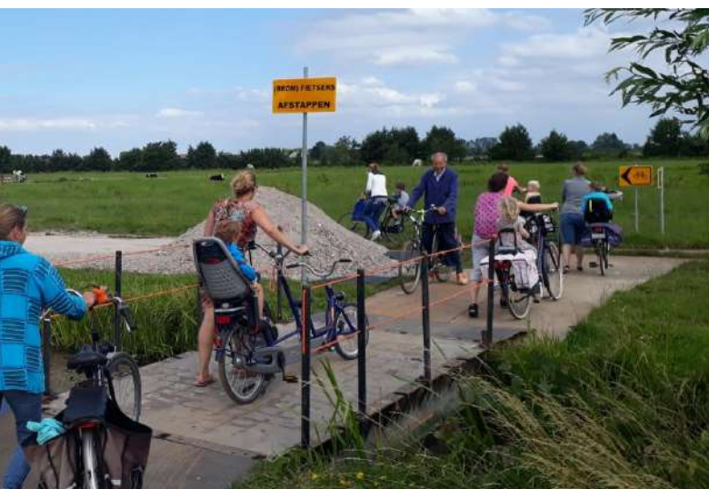
Afbeelding 1 - Tijdelijke brug ten behoeve van doorgang fietsers Oortjespad

Vanaf week 36 starten wij met het aanbrengen van de dammen ter hoogte van de Reigerstraat en de Leeuwerikstraat. Op deze dammen worden de tijdelijke aansluitingen van het kavelpad op de woonwijk gemaakt.