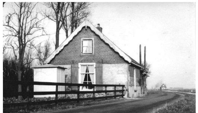
Foto van boerderij 'De Meent' gelegen langs de 'Teckopsche Molenvliet'. Achter het huisje stond een stal met plaats voor 6 koeien, een hooibergje en een varkensschuur. Vooraan staat een trafohuisje wat nu nog langs het huidige fietspad staat. Rechtsachter zien we nog het huisje dat bij de 'machine' van Teckop stond.

Van Gijsbert Willemsz de Bruijn is bekend dat hij gedoopt is op 20 april 1777 te Zegveld en overleden op 4-10-1875 te Kamerik op boerderij 'Welgelegen', Van Teylingenweg 100. Volgens de kadastrale atlas was hij in 1832 de rijkste boer van Kamerik!