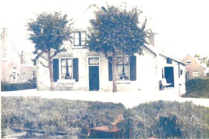
Foto uit midden vorige eeuw van boerderij "Briemensteijn" op het huidige adres: Van Teylingenweg 22. Aan de bebouwing links kun je nog de bestaande woning van Van Teylingenweg 23 herkennen.

Tussen de huisarts en de boerderij op naastgelegen foto moest de Van Teylingenweg afbuigen richting Spruitweg en hierdoor werd het voorste gedeelte gesloopt en kwam er een nieuwe voorgevel.